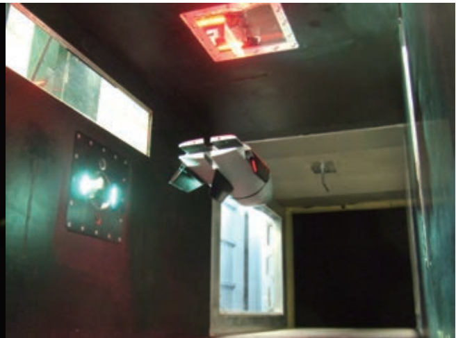
宇宙往還機模型 (上下逆、後方より視る) Winged spaceplane model (suspended upside-down ; seen from aft )