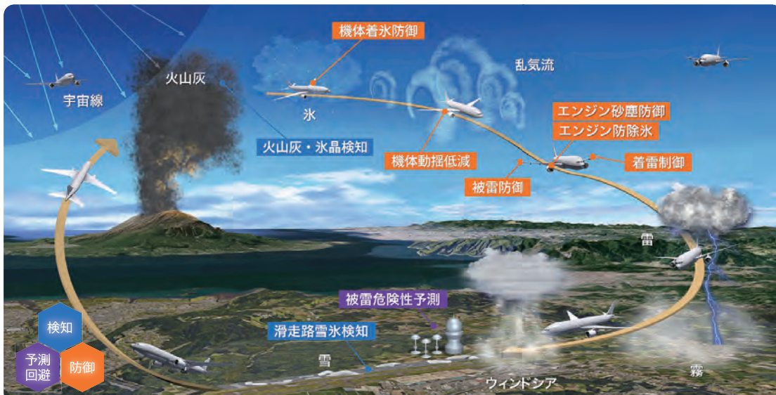
特殊気象 (雪氷・雷・火山灰・乱気流等) から航空機を守るため、機体・滑走路の状態や気象状況を検知し、予測・防御する気象影響防御技術

株式会社 IHI アドバンスソフト株式会社 株式会社 ikura AI 株式会社ウェザーニュース AeroEdge 株式会社 エスペース株式会社 株式会社エムティーアイ 九州大学応用力学研究所再生可能流体エネルギー研究センター 札幌市立大学 株式会社 ZIPAIR Tokyo 株式会社 JALUX 株式会社ソニック 大同大学 DoerResearch 株式会社 名古屋大学宇宙地球環境研究所 日本アビオニクス株式会社 日本ペイント・サーフケミカルズ株式会社 福井県 古野電気株式会社 北海道エアポート株式会社 北海道大学大学院理学研究院 三菱重工業株式会社 民間機セグメント 事業開拓室 三菱電機株式会社 情報技術総合研究所 三菱電機ソフトウェア株式会社 メトロウェザー株式会社 山田技研株式会社